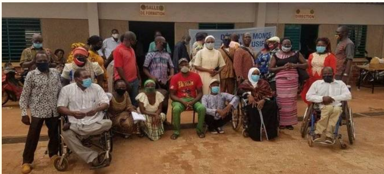
Centre pour les personnes handicapées, Bobo Dioulasso