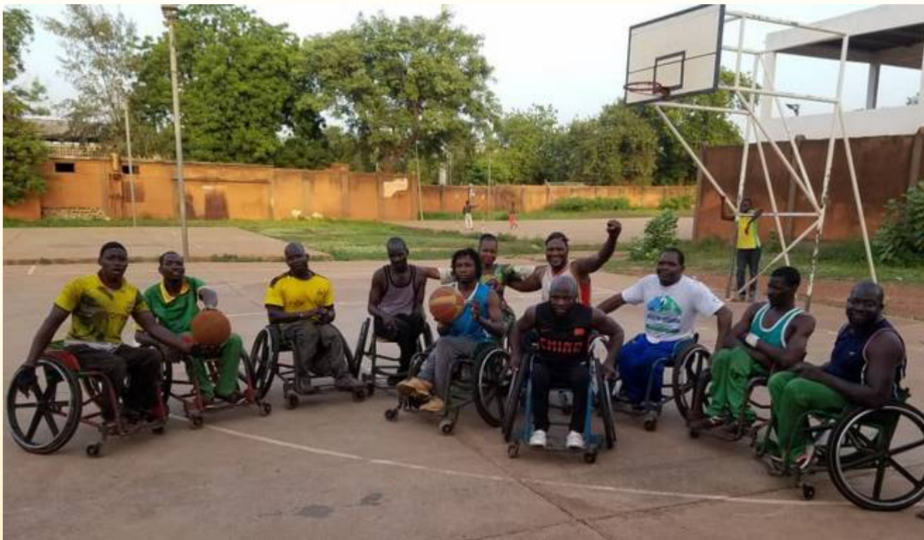
Equipe de handibasket de Kassibana